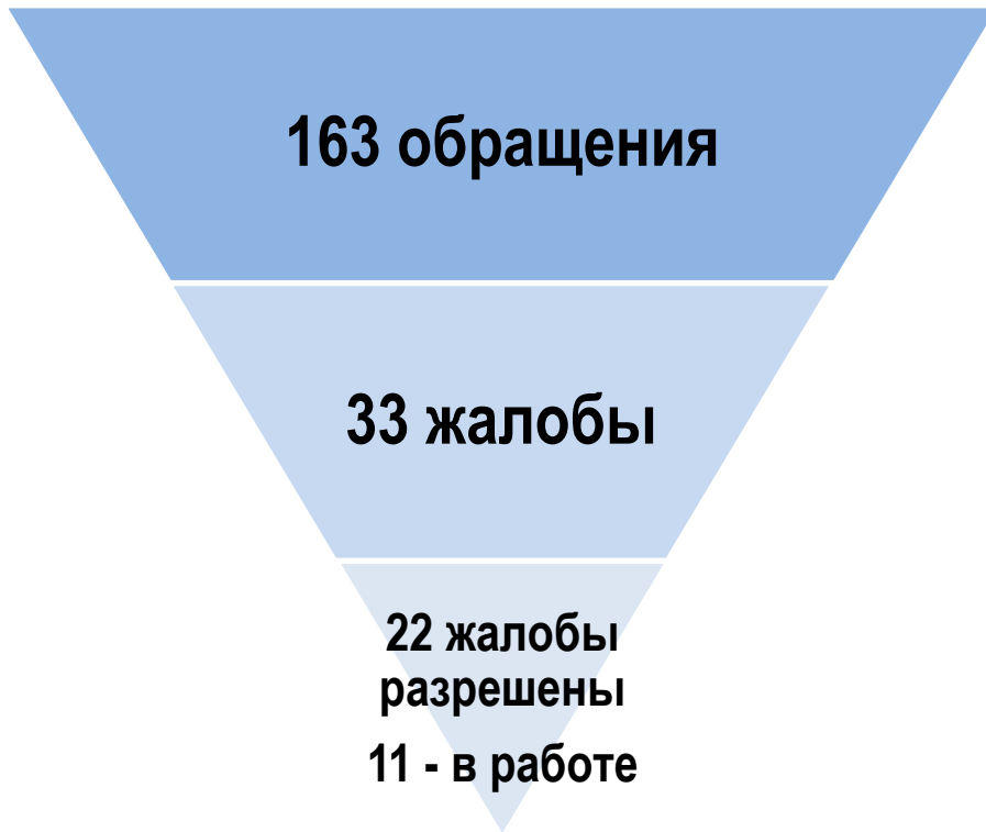
Воронка обращений – 2018 год