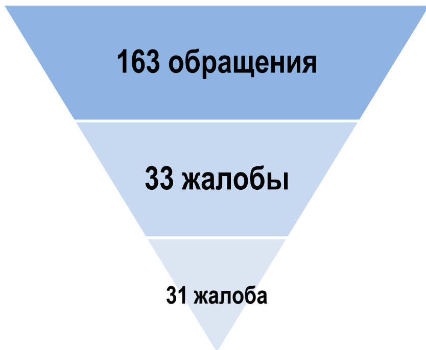
Воронка обращений - 2018 год