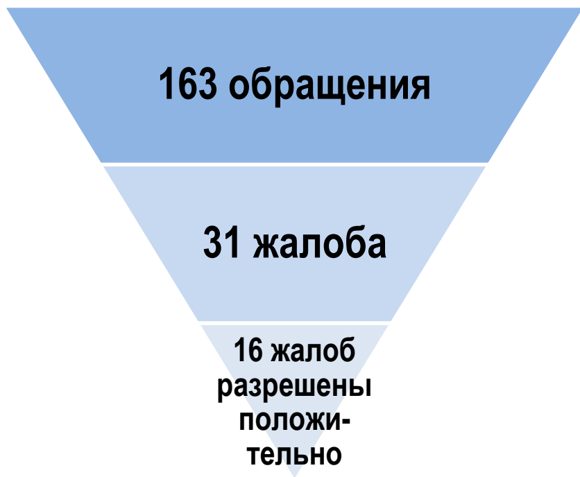
Воронка обращений - 2018 год