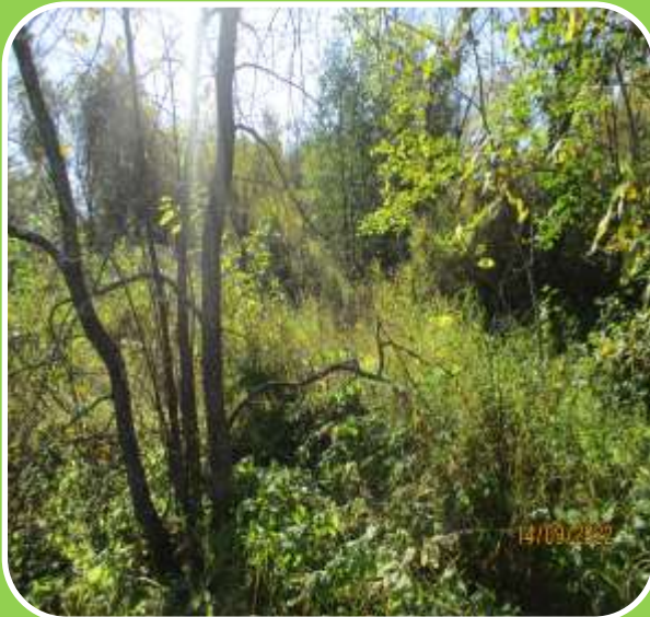
Заращение сорной растительностью