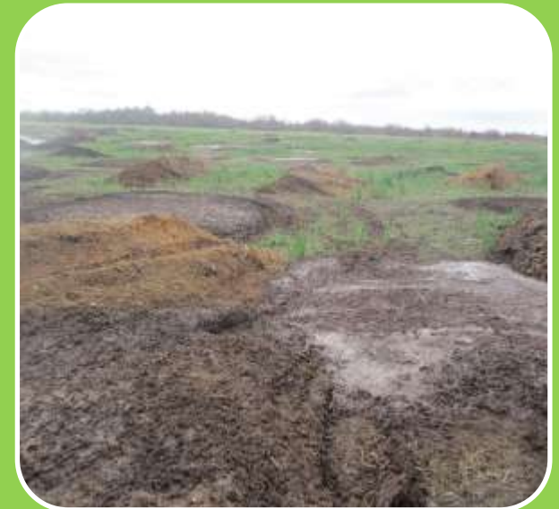
Складирование навоза КРС