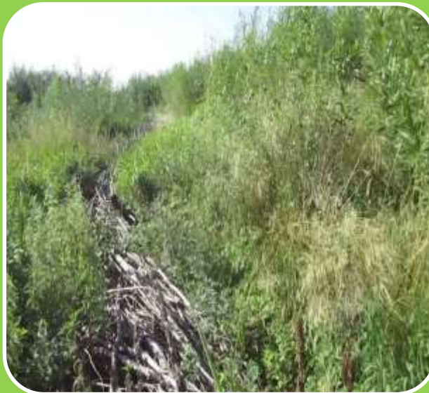
Перекрытие плодородного слоя почвы