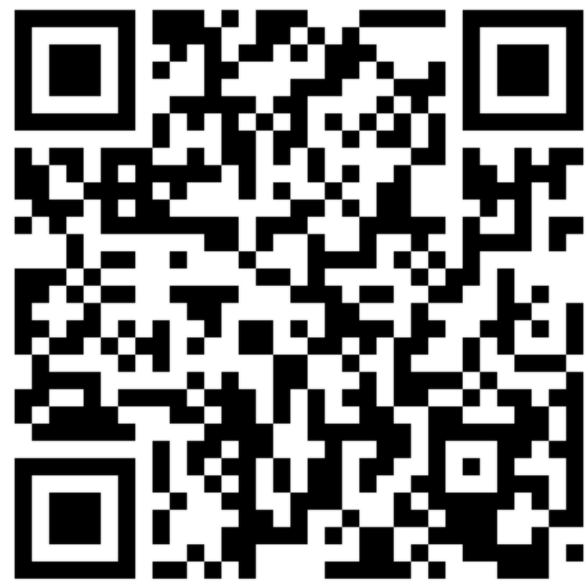
Сайт бизнес- защитник.рф